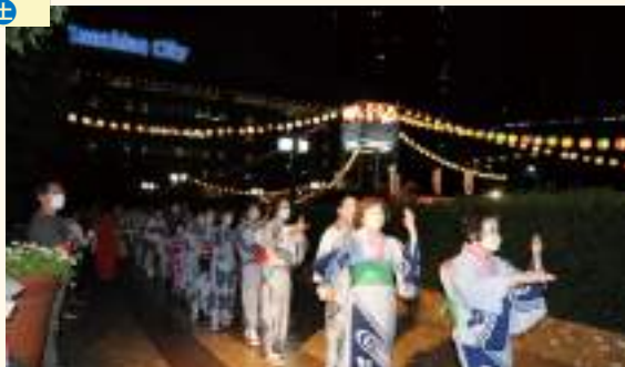
納涼盆踊りの様子

令和4年8月5日、6日の2日間、「第43回サンシャインシティ納涼盆踊り大会」がサンシャイン広場で開催されました。4日から開催される予定でしたが、悪天候の為、初日は中止となりました。