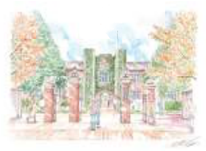
表紙イラスト：立教大学 イラスト提供：豊島マーチング委員会

●豊島マーチング委員会とは 「豊島マーチング委員会」による地域活性化を支援する活動です。豊島区の身近な風景をイラストにして区民が地元を自慢できるコミュニケーションツールになること、また、地元に限らず、多くの方々にさまざまな角度の豊島区を知っていただくことを目的としています。