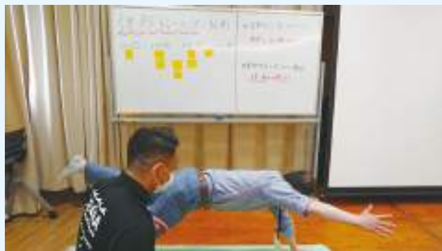
体幹トレーニングを体験

その後、映像とともに出展企業のご紹介があり、それぞれ興味のあるブースでいろいろな体験をしました。また飲食ブースも美味しいカツサンド、サラダ、ミネストローネスープ、煮卵、身体が温まるビールージュ（健康食品）入り紅茶、グリーンコーヒー（焙煎する前のコーヒー）、発酵ミネラルエキスジュース、糖質ゼロのサントリーパーフェクトビール、デザートに無添加アイスバー（高知県雪ヶ峰牧場のジャージー牛乳、ゆず）、ロカボ羊羹、低カロリー羊羹と盛り沢山で、お腹の中からも元気になりました。