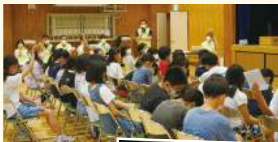
質問コーナーでは小学生からたくさん手が挙がりました