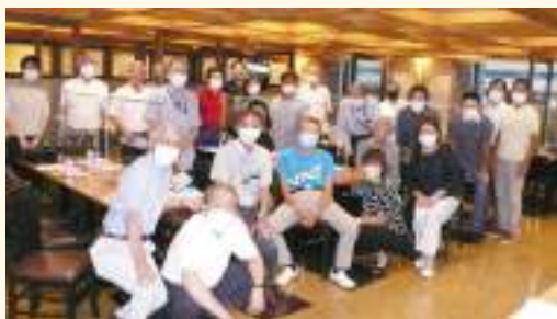
参加者全員で記念写真を撮影

経営研究会は、新型コロナウイルス感染症対策に万全の準備をし、意見交換会・交流会を開催しました。