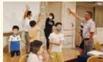
ビンゴ大会の後、じゃんけん大会も開催しました

8月26日、ホテルメトロポリタンにて、青年部会主催のチャリティー暑気払いを開催しました。青年部会OB、青年部会員と家族を含め51名が参加し、会員家族同士の親睦・交流を深めました。また、恒例のビンゴ大会では子供も大人も大いに盛り上がり楽しむことができました。