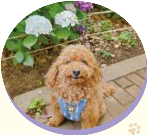
石井ケイクン (8歳) トイプードル 特技: 靴下キャッチ