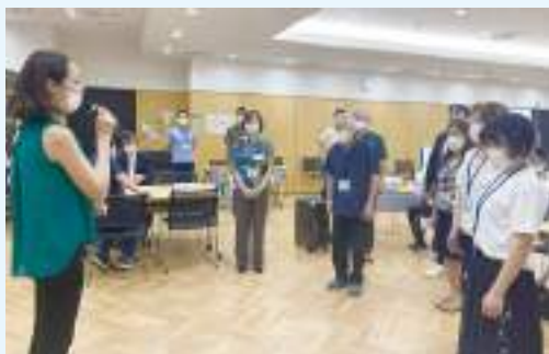
参加者全員がウォーキング教室に参加