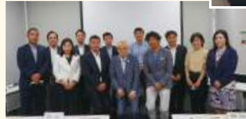
区長との記念撮影